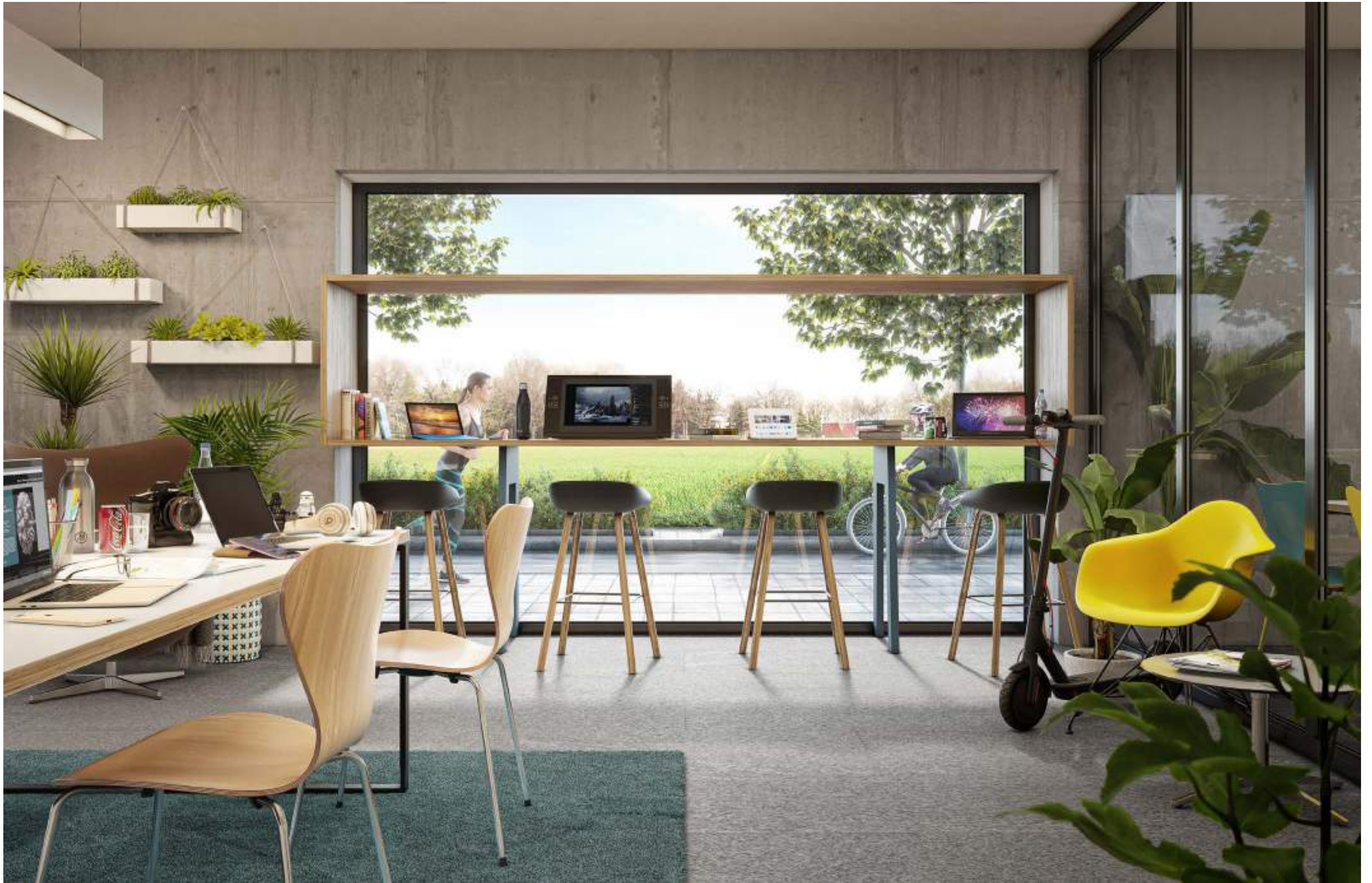
SPAZIO SMART WORKING RISERVATO