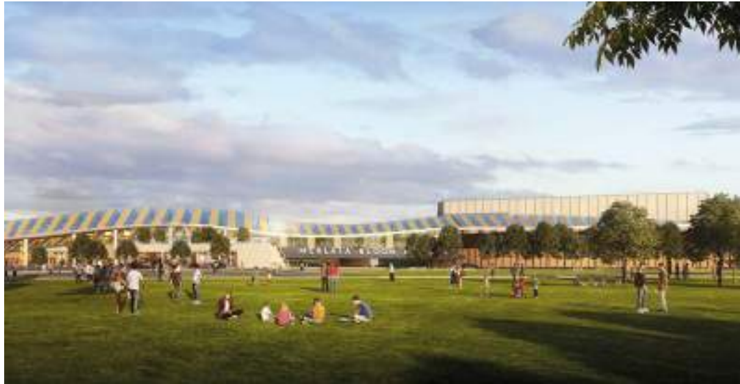
EDIFICIO OVEST E PONTE Vista dal Parco